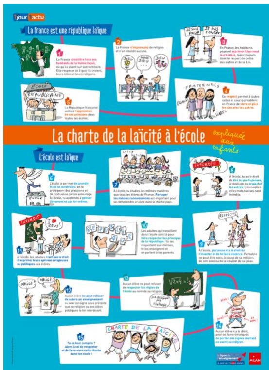
Figure 3 : Charte de laïcité 1

Voici deux exemples de « La charte de laïcité à l'école » (annexes 4 et 5) utilisés par les enseignants interviewés ;