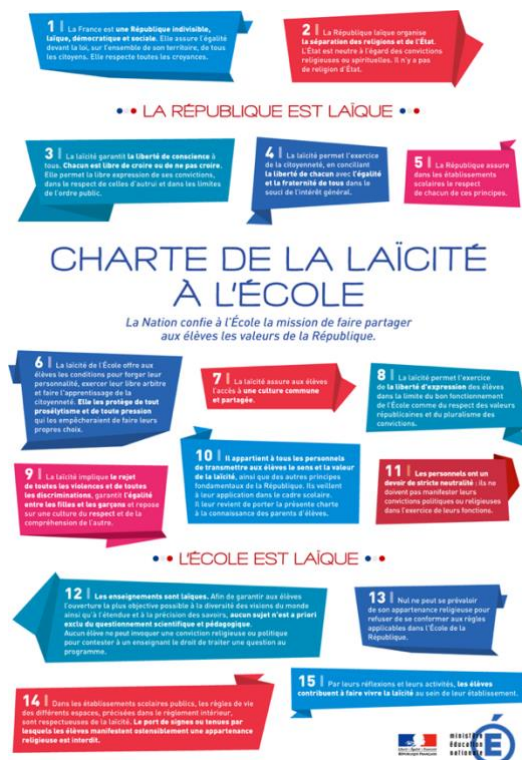
Figure 4 : Charte de laïcité 2

À travers cette charte de laïcité à l'école, on prend connaissance des différences entre le système suisse et français. Pour les enseignants français, il est important de transmettre que la laïcité correspond aussi au fait d'avoir le droit de croire ou de ne pas croire, mais qu'il ne faut pas imposer notre point de vue à autrui, et que cela n'aura jamais d'impact tout au long de leur vie. C'est pour cela que nous allons aborder les disparités entre les deux programmes scolaires.