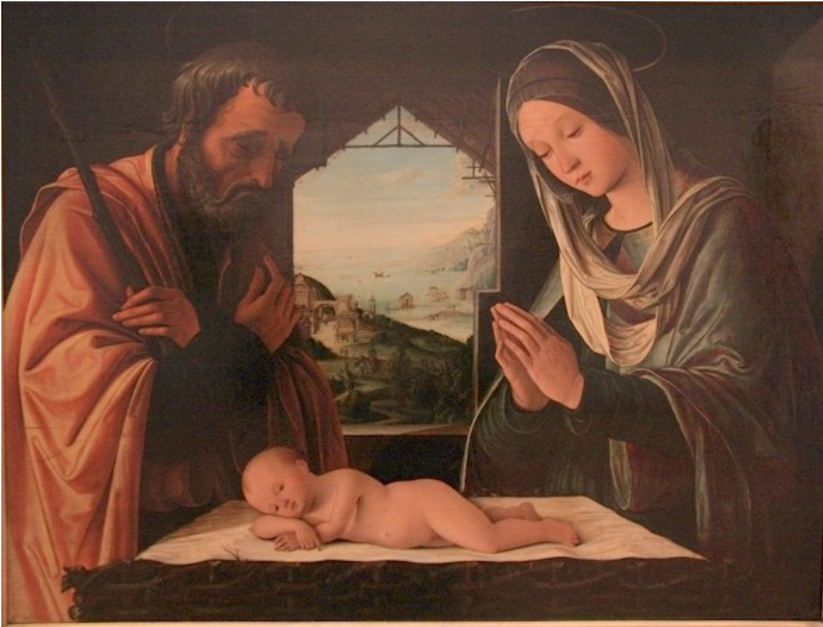
La Nativité de Lorenzo Costa - vers 1490 (Musées des Beaux-Arts de Lyon)

3) Quelles teintes sont utilisées ? Pourquoi ?