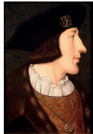
Charles III de Savoie, par Jean Clouet