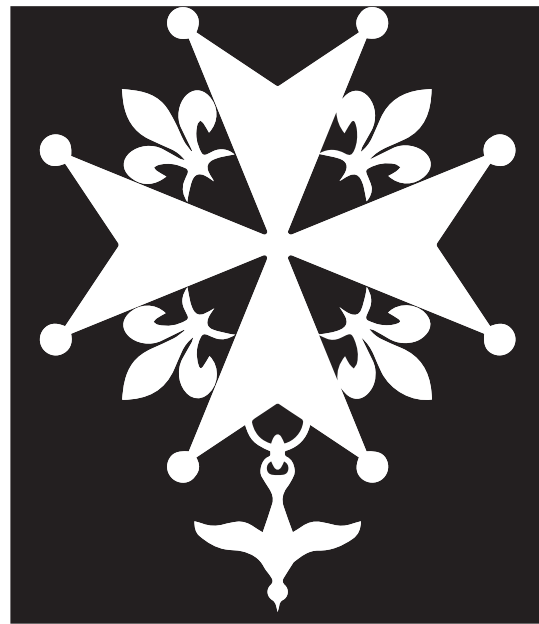
La crois huguenote