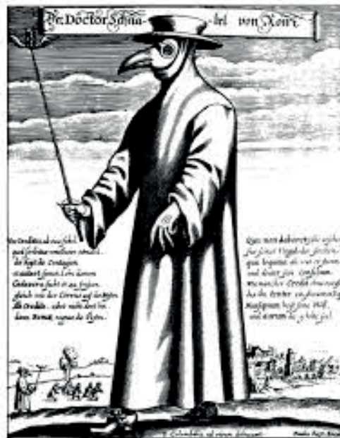
Un médecin de peste à Rome, pendant une épidémie de peste, portant un masque de protection