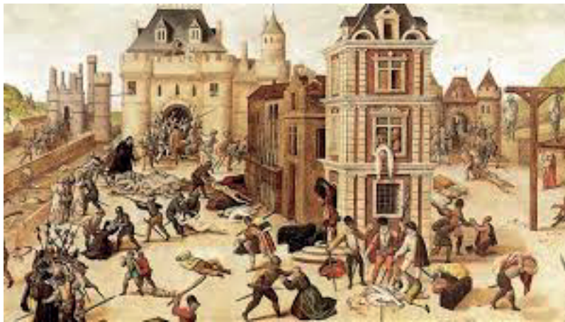
Massacre de la Saint-Bartélémy, François Dubois (1529-1584) Musée Cantonal de Beaux-Arts de Lausanne