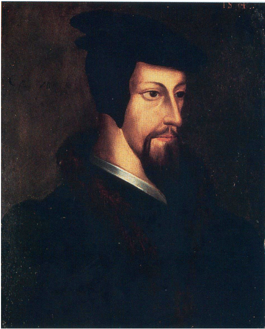
Portrait de Jean Calvin, source inconnue, BPU, Genève