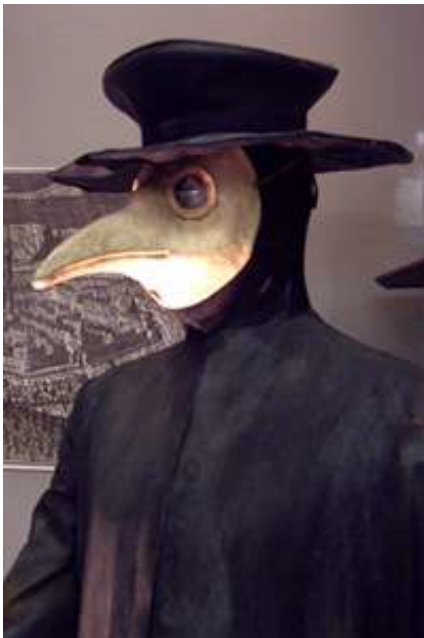
Protection des médecins de la peste contre l'épidémie