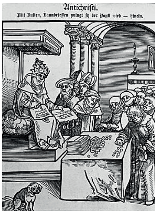
Le Pape signant et vendant des indulgences vu comme l'Antéchrist par Lucas Cranach l'Ancien d'après le Passional Christi und Antichristi de Martin Luther (1521)