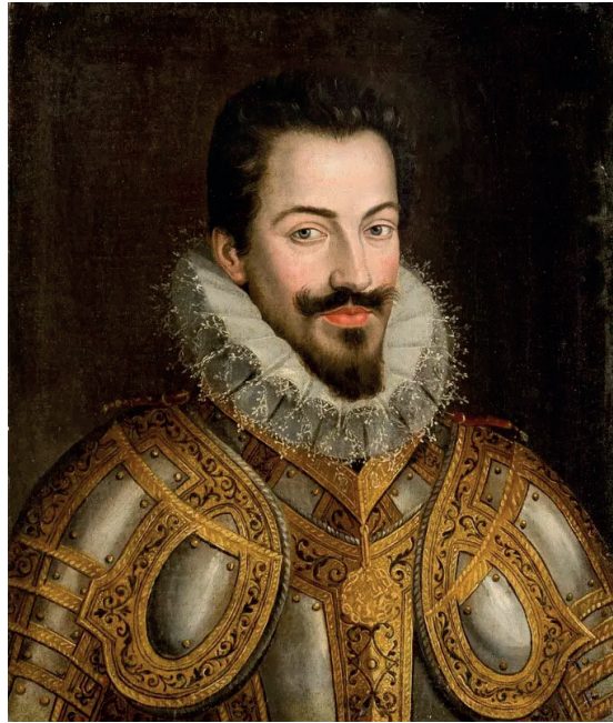
Portrait d'Emmanuel-Philibert de Savoie, Kunsthistorisches Museum Wien, Gemäldegalerie